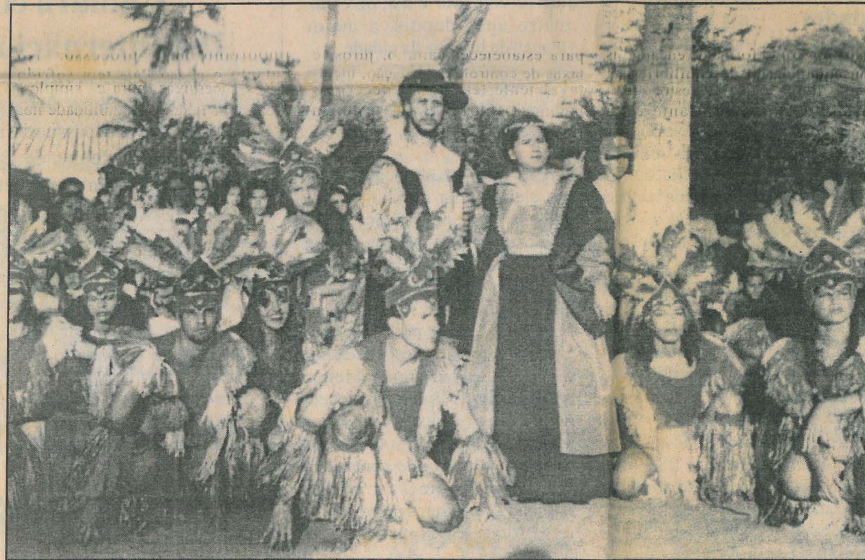
Integrantes do Balé Popular do Recife, ao encenar a chegada de Duarte Coelho no Sítios dos Marcos