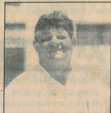
Sec. de Desenvolvimento Econômico, Marcondes Gonçalves

De acordo com Marcondes Gonçalves, as mudanças no secretariado foram apenas um ajuste na máquina administrativa, para fazê-la funcionar melhor. Assim que assumiu o novo cargo, Gonçalves já come-